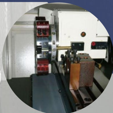
八位置油壓刀塔 8-position hydraulic turret