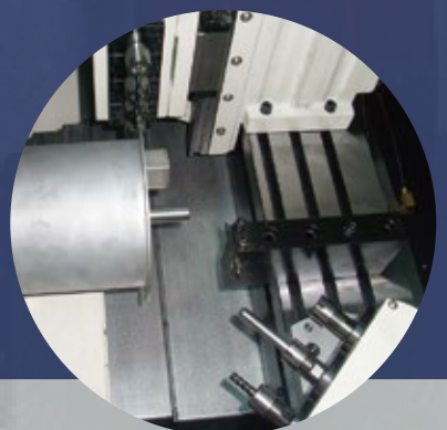
(選配) 三軸鑽孔及攻牙裝置 (B軸) (角度型) Inclined surface live tooling device (Opt.)