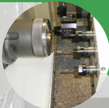
(選配) 三軸端面鑽孔及攻牙裝置 B-axis end side live tooling device(3-shaft) (Opt.)