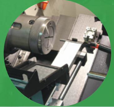
(選配) 單件自動進/退料裝置 Automatic single workpiece loading & unloading device (Opt.)