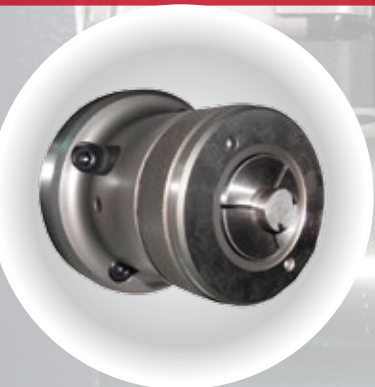
(選配) 筒夾套 A2-6 60# Collet chuck(opt.)