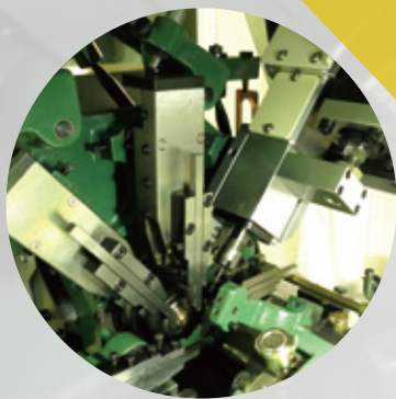
側鑽轉速最高5000rpm/孔徑最大10mm Side drilling Max. Speed:5000rpm Max. I.D.:10mm