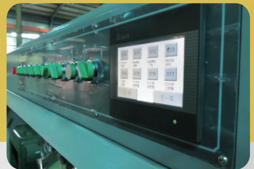
人機介面控制 NC Interface Control